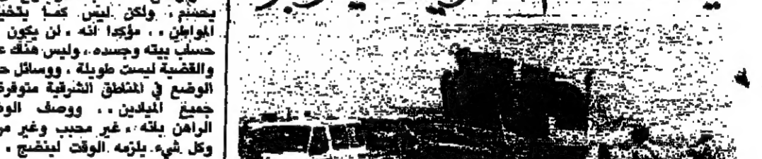
خلال التدريب في أجواء الضيقة مصارع ٧ جنود اسرائيليين في اصطدام طائرتي هليكوبتر

خلال التدريب في أجواء الضيقة مصارع ٧ جنود اسرائيليين في اصطدام طائرتي هليكوبتر. وقال الجيش الاسرائيلي امس ان ٧ جنود اسرائيليين أصيبوا بجروح خطيرة في تصادم طائرتي هليكوبتر في اجواء ضيقة قرب غزة. وقال الجيش الاسرائيلي امس ان ٧ جنود اسرائيليين أصيبوا بجروح خطيرة في تصادم طائرتي هليكوبتر في اجواء ضيقة قرب غزة.